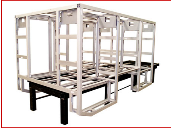
Estructura sistema TECIN® ALU/TEC®

Externa: Por medio de 6 focos direccionables ubicados en las partes traseras y laterales del techo de la unidad.