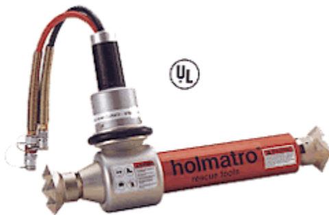
Cilindros 3321, 3322, 3331